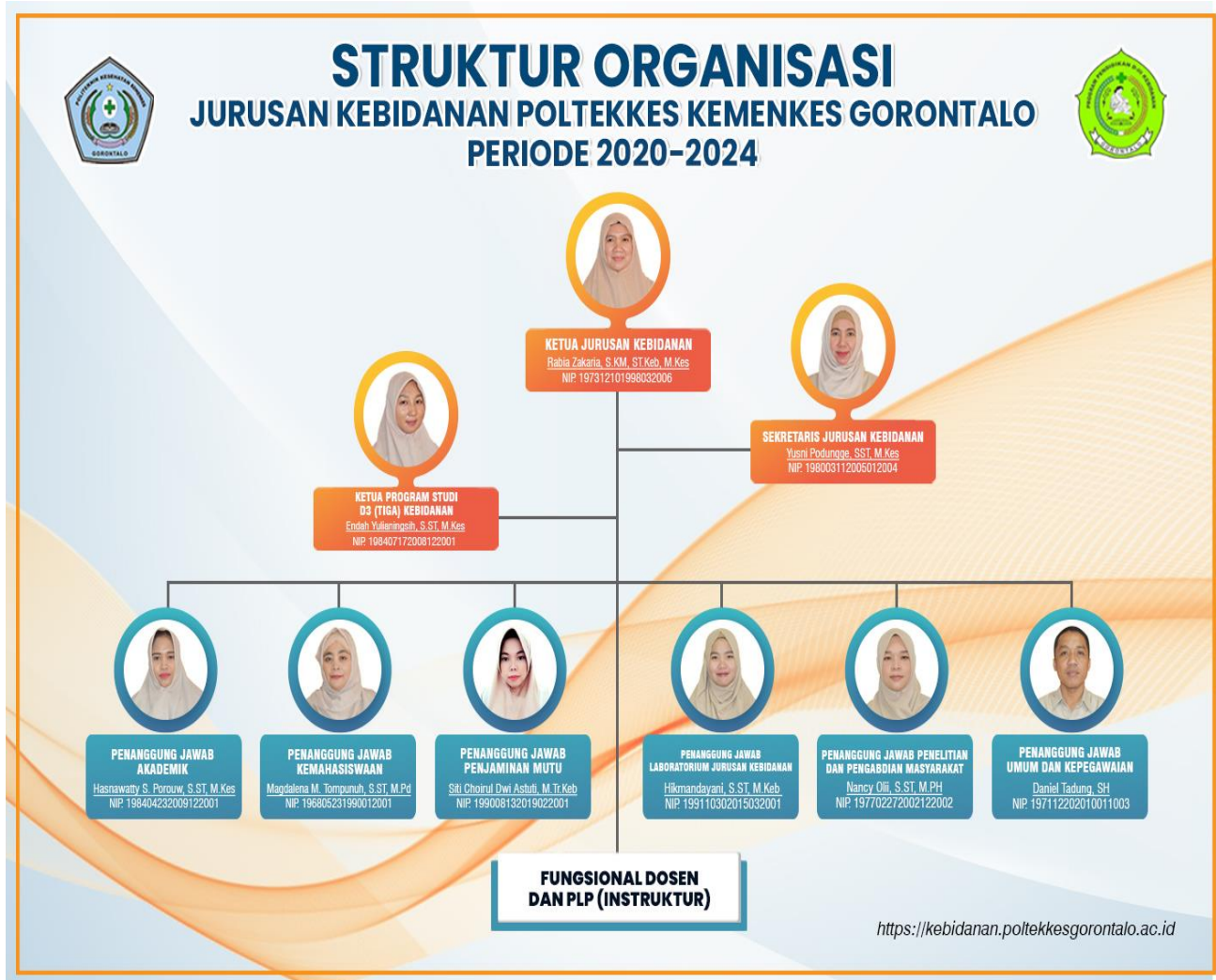
Gambar 1. Struktur Organisasi Jurusan Kebidanan

Struktur Organisasi Jurusan Kebidanan Politeknik Kesehatan Kemenkes Gorontalo tahun 2021